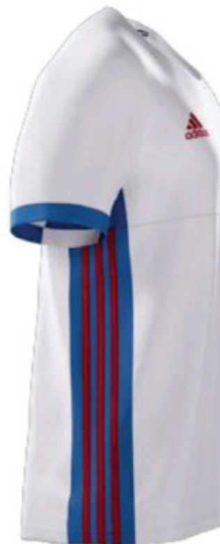
MAGLIA DA GIOCO